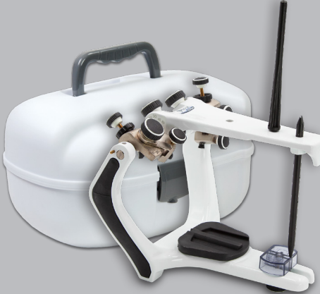
Réf. 010103 Articulateur + Étui