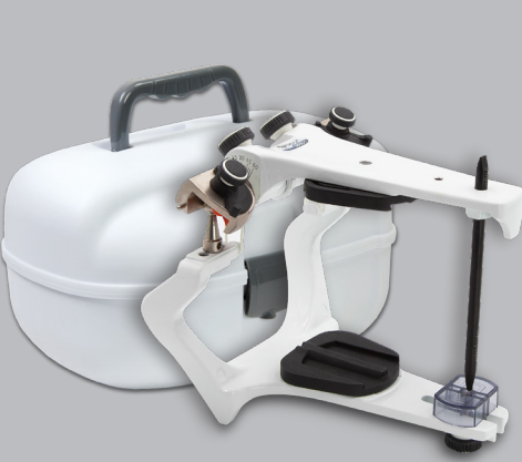
Réf. 010107 Articulateur + Étui