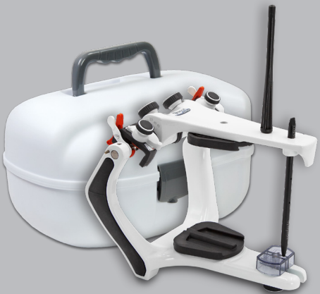
Réf. 010099 Articulateur + Étui