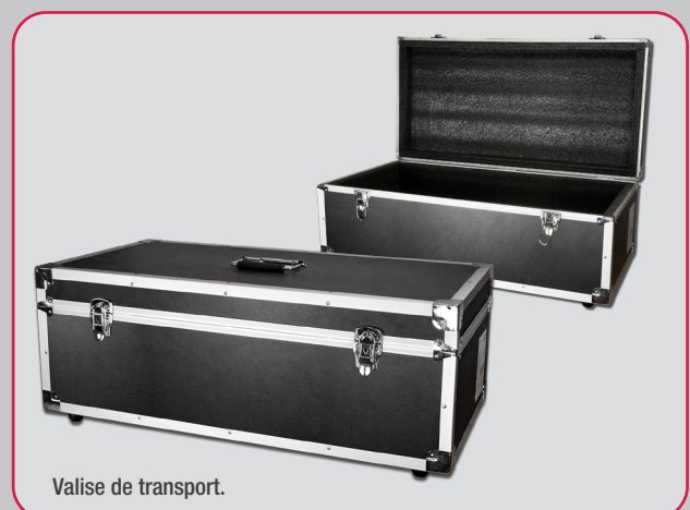
Valise de transport.