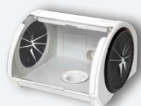
Box de retouche pour cabinet REF. 080534C