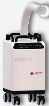
Sirocco M avec bras de serpent REF. 080536B (à usage unique petit filtre) REF. 080536E1 (filtre réutilisable 4.3 l) REF. 080536E2 (filtre réutilisable 2.5 l)