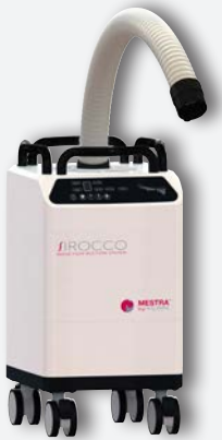
Sirocco M avec tube flexible REF. 080536A (à usage unique petit filtre) REF. 080536D1 (filtre réutilisable 4.3 l) REF. 080536D2 (filtre réutilisable 2.5 l)