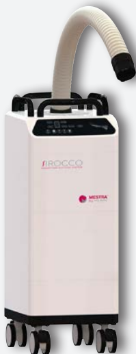
Sirocco L avec tube flexible REF. 080537A (à usage unique grand filtre) REF. 080537D (filtre réutilisable 7.5 l)