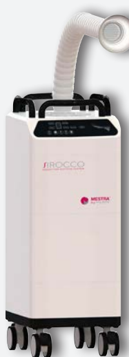
Sirocco L avec bras de serpent REF. 080537B (à usage unique grand filtre) REF. 080537E (filtre réutilisable 7.5 l)