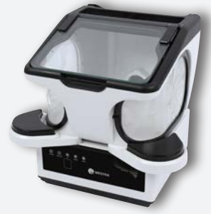
Sirocco S avec box de retouche au laboratoire REF. 080534AL