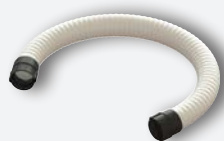
Tube flexible REF. 080536-07