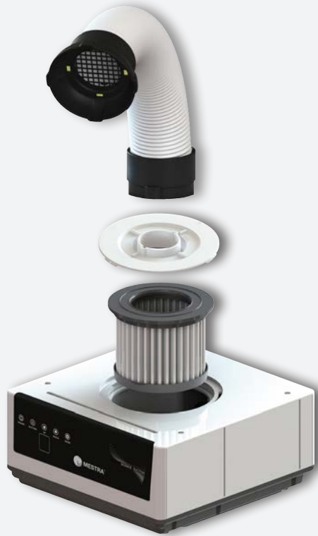
Aspiration Sirocco S REF. 080534

Aspiration spécialement indiquée pour les cabinets et les laboratoires dentaires. Elle a la taille parfaite pour la poser sur l'établi. Esthétique soignée.