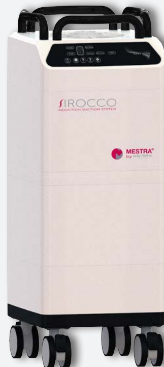
Aspiration Sirocco L REF. 080537