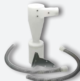
Décanteur de poussières Ciclón REF. 080535