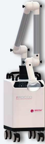
Sirocco M avec bras articulé REF. 080536C (à usage unique petit filtre) REF. 080536F1 (filtre réutilisable 4.3 l) REF. 080536F2 (filtre réutilisable 2.5 l)