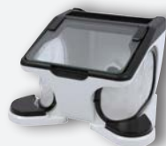
Box de retouche pour laboratoire REF. 080534L