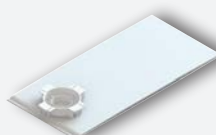
A usage unique grand filtre REF. 080537-03