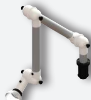
Bras articulé REF. 080536-09