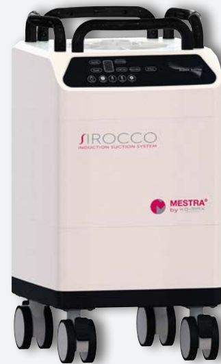
Aspiration Sirocco M REF. 080536