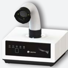
Sirocco S avec tubes LED REF. 080534AT