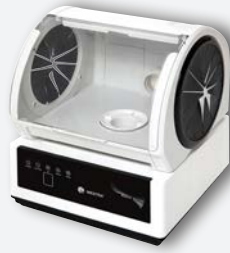
Sirocco S avec box de retouche au cabinet REF. 080534AC