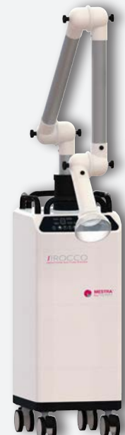
Sirocco L avec bras articulé REF. 080537C (à usage unique grand filtre) REF. 080537F (filtre réutilisable 7.5 l)