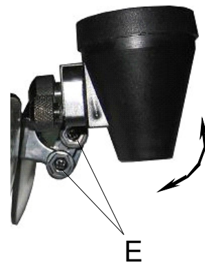
Fig. 4 Abb. 4