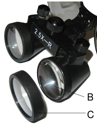
Fig. 2 Abb. 2